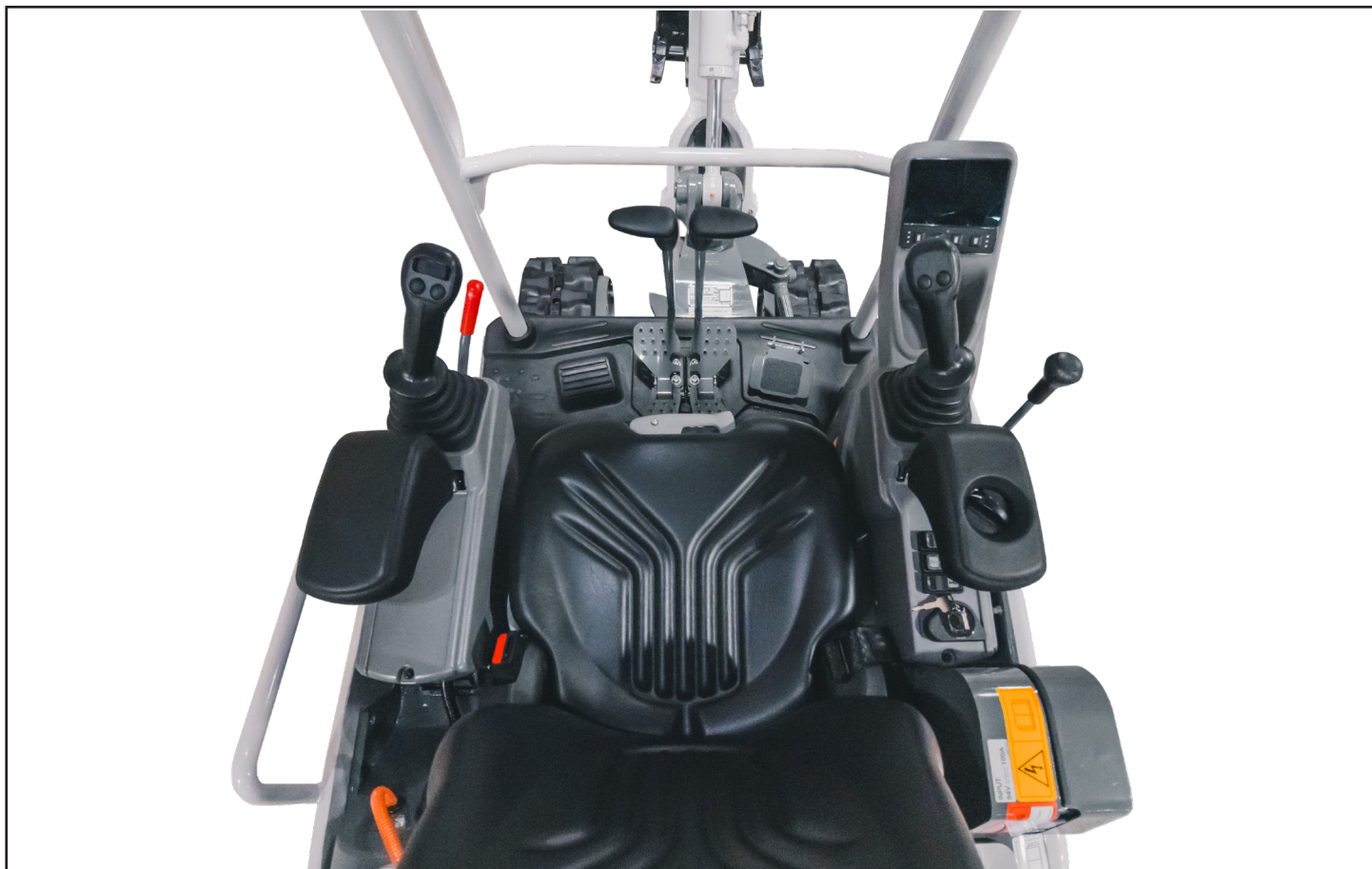
Rymlig och stilren inredning i personbilstil

För kunder som vill minska sitt koldioavtryck samtidigt som de får jobbet gjort i tid och med minimal stilleståndstid erbjuder Takeuchi TB20e riklig produktivitet och en minskning av de totala driftkostnaderna i samband med traditionella dieseldrivna anläggningsmaskiner.