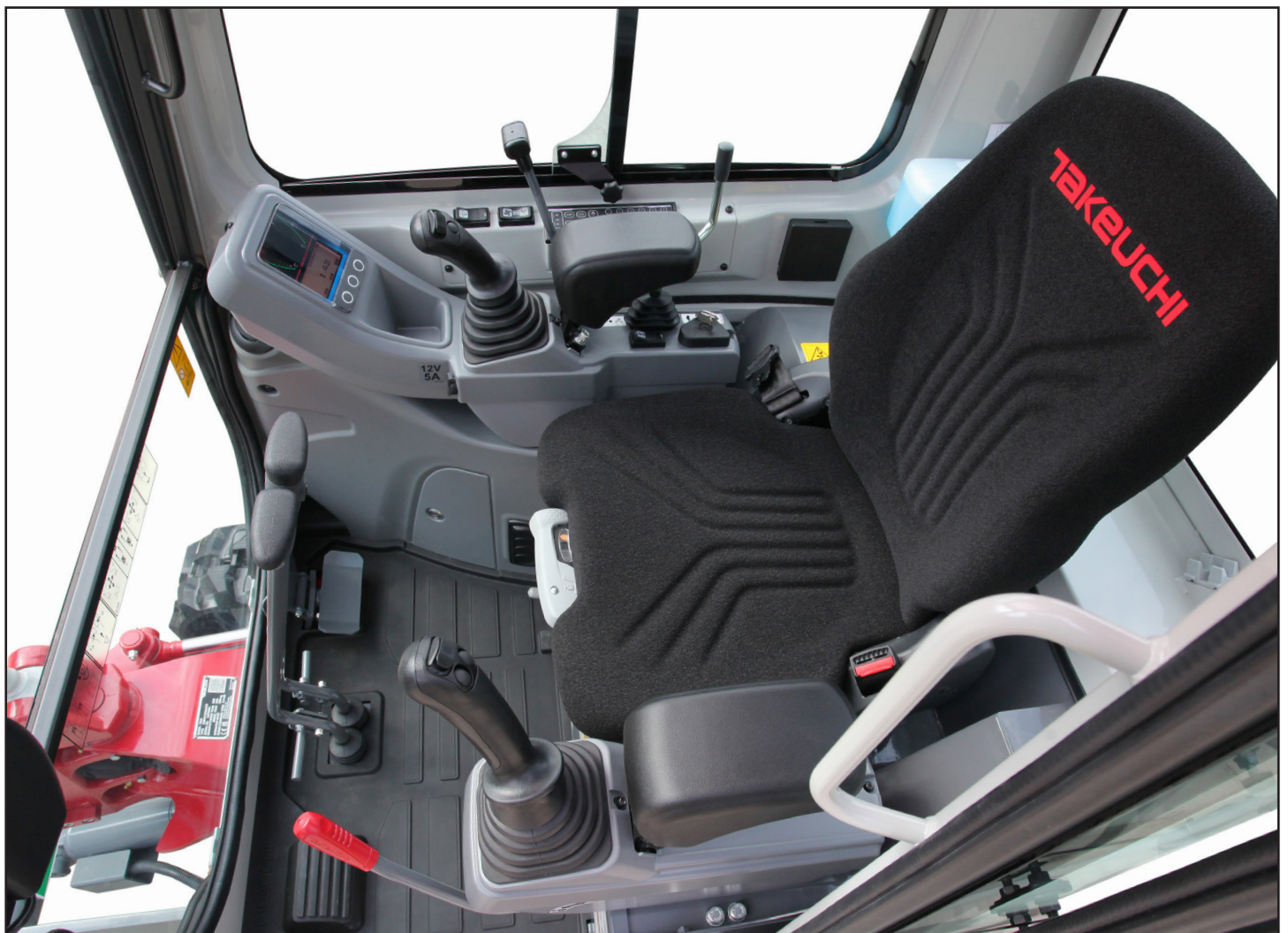
Fullständig nydesignad interiör i personbilstil, med intuitiva manöverfunktioner

Operatörsstationen, som finns i kåpa/hyttkonfigurationer, är utformad med användarens komfort i åtanke. Den erbjuder komfort hela dagen med en justerbar fjädringssäte, ett rymligt golvutrymme med integrerade fotstöd, ergonomiskt utformade pilotreglage och justerbara armstöd. Den 3,5-tum stora multifunktionsdisplayen visar viktig maskininformation med en blick, vilket säkerställer operatörens komfort och användarvänlighet. TB320 är en konventionell svängstjälsgrävare, vilket gör den till en mycket stabil plattform med utmärkt lyftkapacitet. Den finns även med upp till fyra extrakretsar, vilket gör det enkelt att lägga till hydrauliskt drivna redskap. Den primära extrakretsen har ett klassledande flöde på upp till 40 l/min. Den styrs med hjälp av en proportionell glidströmbrytare på den vänstra joysticken, vilket gör det möjligt för operatören att dosera flödet till redskapet.