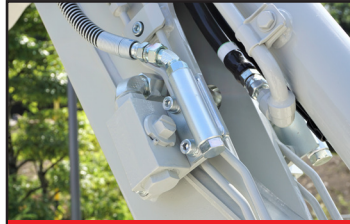
Flera serviceportar (upp till 4)