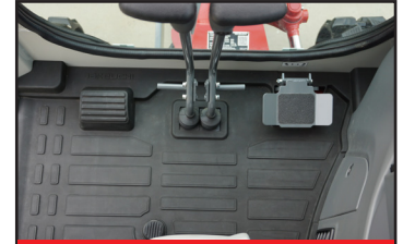
Stort golv med fotstöd

Utformad för att arbeta i trånga och krävande miljöer erbjuder Takeuchi TB320 många framsteg inom prestanda och teknik, vilket gör den till en extremt mångsidig och produktiv maskin. Den är lätt att transportera och väl lämpad för arbete i en mängd olika tillämpningar, från urbana byggarbetsplatser till områden med begränsad tillgång, såsom företag, lägenheter och hem. En viktig funktion på TB320 är det hydrauliskt styrda, variabelbredda underredet som kan dras in till 980 mm och utvidgas till 1370 mm brett. Med underredet helt indraget kan maskinen enkelt manövrera sig genom smala passager för att komma till arbetsplatsen. Väl på plats kan underredet utvidgas för att ge optimal balans och stabilisering.