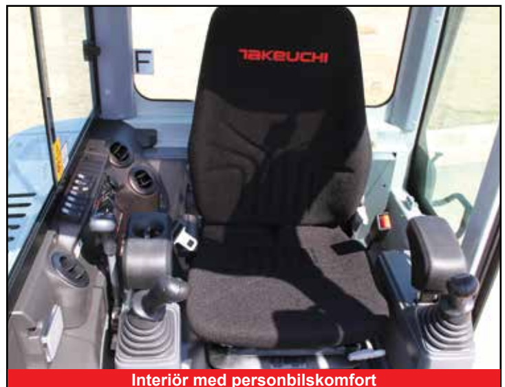
Interiör med personbilskomfort

*Funktionerna är eventuellt inte tillgängliga i alla länder. Kontakta din Takeuchi-återförsäljare för mer information.