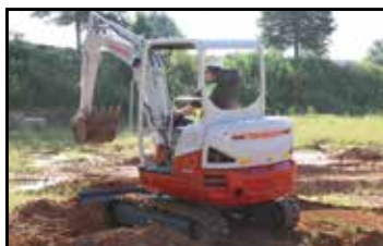
Byggt helt i stål