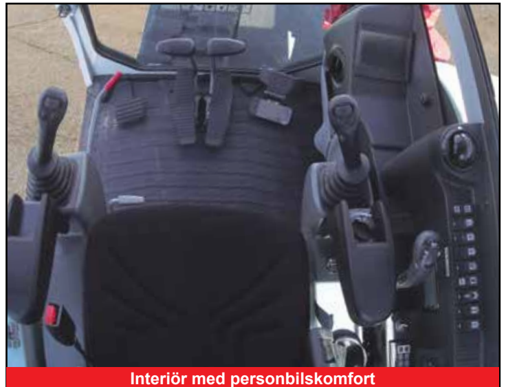
Interiör med personbilskomfort

*Funktionerna är eventuellt inte tillgängliga i alla länder. Kontakta din Takeuchi-återförsäljare för mer information.