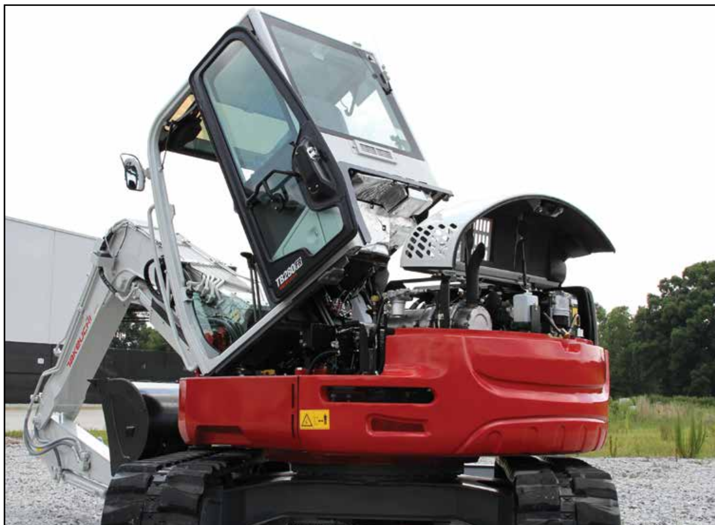
Fällbar hytt och stora, läsbara servicehuvar ger enkelt åtkomst för service och underhåll

maskinen kan arbeta inom samma begränsningar som en mindre 5-tonsmaskin för högre prestanda och produktivitet. Andra egenskaper är en uppdaterad hytt med interiör med personbilskomfort, multidisplay i färg, förinställningar för flera redskap med flöden som ställs in av föraren, hjälphydrauliketsar 1 och 2 som standard för en rad olika redskap, återfyllningsblad och fällbar hytt för lättåtkomlig service.