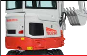
Bakdel med liten svängradie