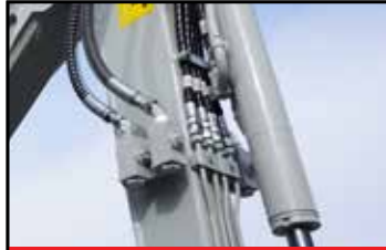
Upp till fyra serviceportar (tillval)