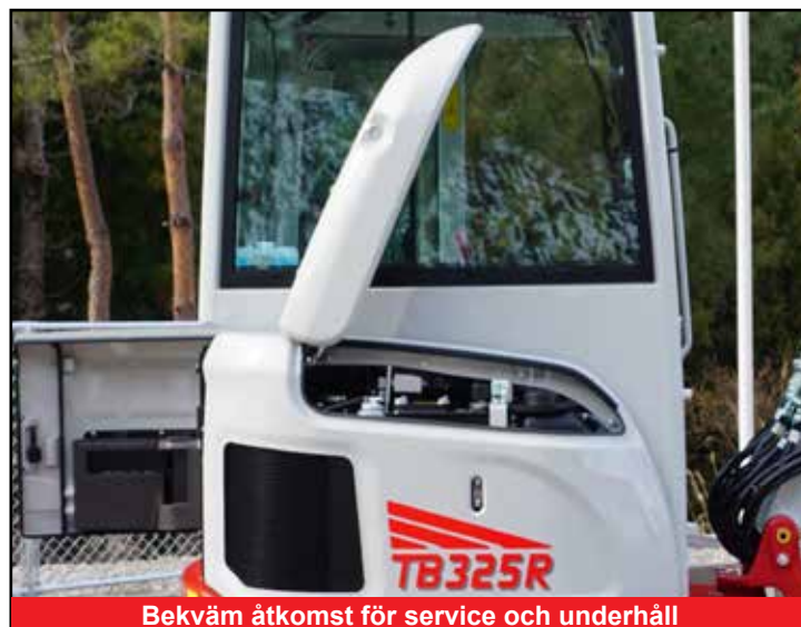
Bekväm åtkomst för service och underhåll

*Funktionerna är eventuellt inte tillgängliga i alla länder. Kontakta din Takeuchi-återförsäljare för mer information.