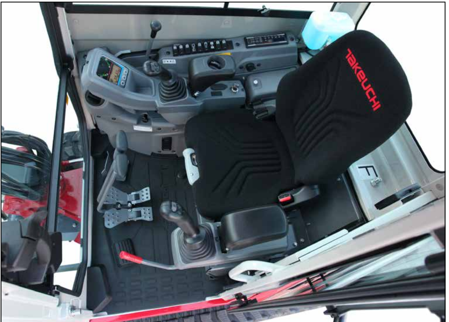
Rymlig förarplats med lättåtkomliga reglage

Till standardutrustningen på TB325R ingår bland annat ett automatiskt bränsleluftningssystem som eliminerar behovet av manuell luftning av bränslesystemet, automatisk tomgångssänkning för lägre bränsleförbrukning, dränering i golvet för enklare rengöring och en robust samt omslutande motvikt som skyddar viktiga maskinkomponenter. Andra egenskaper på TB325R är ett paket med LED-arbetslampor och flera hjälphydraulikretsar. Som tillval finns även telematiksystemet Takeuchi Fleet Management (TFM).