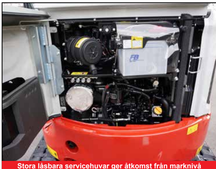
Stora låsbara servicehuvar ger åtkomst från marknivå